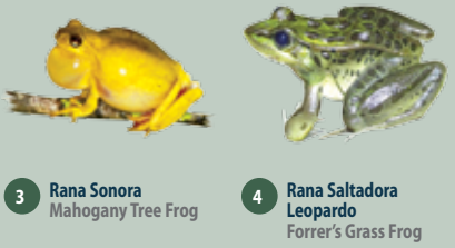
3 Rana Sonora Mahogany Tree Frog 4 Rana Saltadora Leopardo Forrer's Grass Frog