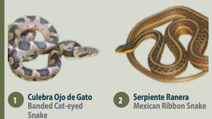
1 Culebra Ojo de Gato Banded Cat-eyed Snake 2 Serpiente Ranera Mexican Ribbon Snake