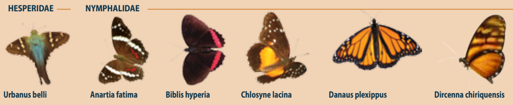
HESPERIDAE — NYMPHALIDAE 1 Urbanus belli 2 Anartia fatima 3 Biblis hyperia 4 Chlosyne lacinia 5 Danaus plexippus 6 Dircenna chiriquensis