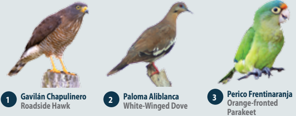
1 Gavilán Chapulinero Roadside Hawk 2 Paloma Aliblanca White-Winged Dove 3 Perico Frentinaranja Orange-fronted Parakeet