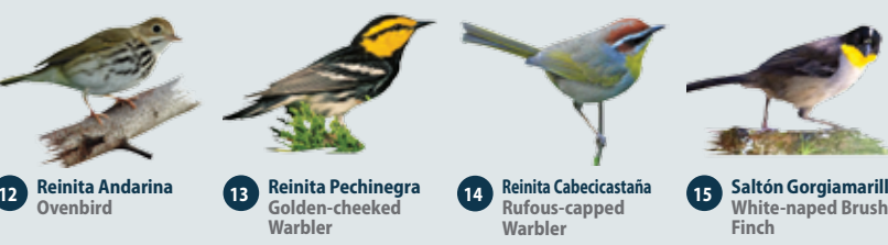
12 Reinita Andarina Ovenbird 13 Reinita Pechinegra Golden-cheeked Warbler 14 Reinita Cabecicastaña Rufous-capped Warbler 15 Saltón Gorgiamarillo White-naped Brush Finch