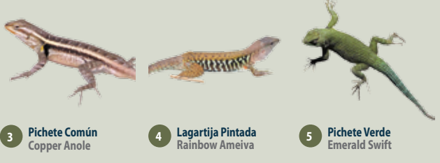
3 Pichete Común Copper Anole 4 Lagartija Pintada Rainbow Ameiva 5 Pichete Verde Emerald Swift