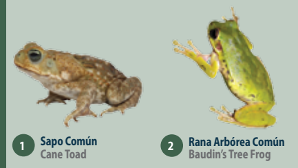
1 Sapo Común Cane Toad 2 Rana Arbórea Común Baudin's Tree Frog