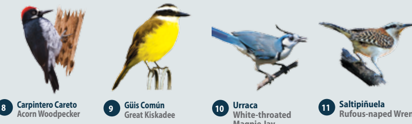
8 Carpintero Careto Acorn Woodpecker 9 Güis Común Great Kiskadee 10 Urraca White-throated Magpie Jay 11 Saltipiñuela Rufous-naped Wren