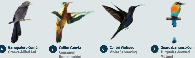
4 Garrapatero Común Groove-billed Ani 5 Colibrí Canela Cinnamon Hummingbird 6 Colibrí Violáceo Violet Sabrewing 7 Guardabarranco Común Turquoise-browed Motmot