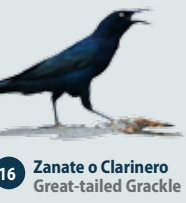
16 Zanate o Clarinero Great-tailed Grackle