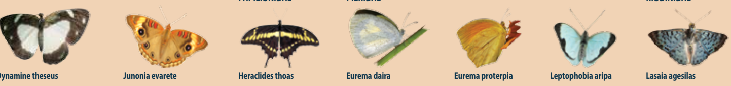
PAPILIONIDAE — PIERIDAE — RIODINIDAE 7 Dynamine theseus 8 Junonia evarete 9 Heraclides thoas 10 Eurema daira 11 Eurema proterpia 12 Leptophobia aripa 13 Lasaia agesilas