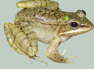
4 Rana Manchada Highland Frog