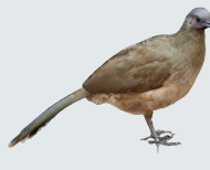
5 Chachalaca Lisa Plain Chachalaca