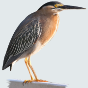
3 Garcilla Capiverde Green Heron