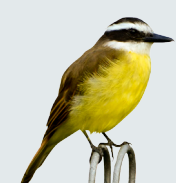
11 Giüs Común Great Kiskadee