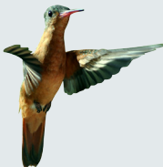
9 Colibrí Canela Cinnamon Hummingbird