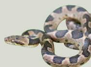
2 Culebra Ojo de Gato Banded Cat-eyed Snake