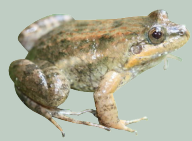
3 Ranita de Charco Fringe-toed Foam Frog