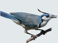
13 Urraca White-throated Magpie Jay