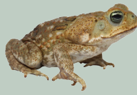
1 Sapo Común Cane Toad