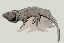
6 Garrobo Black Iguana