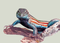
3 Lagartija Corredora Rayada Black-bellied Racerunner