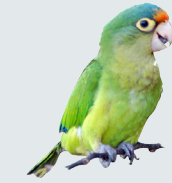
7 Perico Frentinaranja Orange-fronted Parakeet