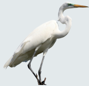
1 Garza Real Great Egret