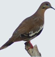
6 Paloma Aliblanca White-Winged Dove