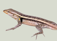
5 Pichete Común/ Rose-bellied Lizard