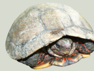
1 Tortuga Pintada Painted Wood Turtle