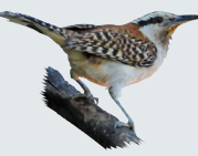
12 Saltipiñuela Rufous-naped Wren