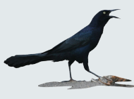
14 Zanate o Clarinero Great-tailed Grackle