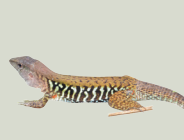
4 Lagartija Pintada Rainbow Ameiva