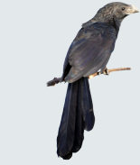
8 Garrapatero Común Groove-billed Ani