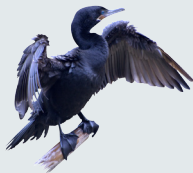
4 Cormorán Neotropical Neotropic Cormorant