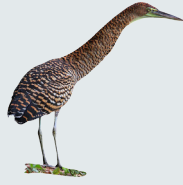
2 Garza Tigre Bare-throated Tiger Heron