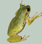
2 Rana Arbórea Común Baudin's Tree Frog