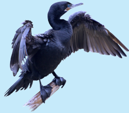
2 Cormorán Neotropical Neotropic Cormorant