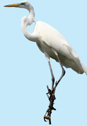
7 Garza Real Great Egret