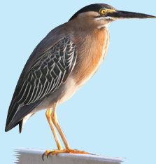
3 Garcilla Capiverde Green Heron