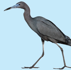
20 Garcilla Común Little Blue Heron