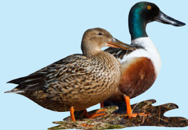
5 Pato Cuchara Northern Shoveler