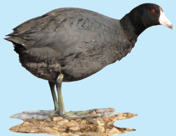
14 Focha Común American Coot