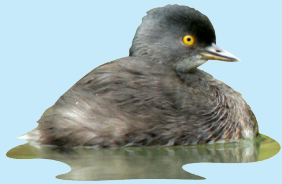
1 Patito Zambullidor Least Grebe