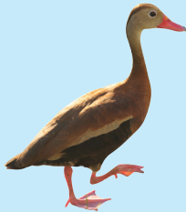
10 Piche Común Black-bellied Wistling Duck