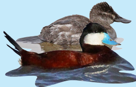
11 Pato Careto Ruddy Duck