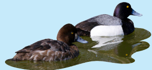
9 Porrón Menor Lesser Scaup