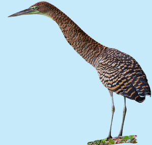
21 Garza Tigre Bare-throated Tiger Heron