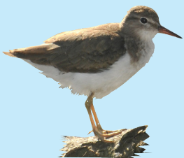
17 Levanta Colita Spotted Sandpiper