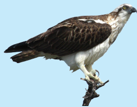
18 Águila Pescadora Osprey