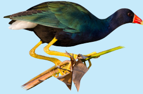
16 Gallareta American Purple Gallinule