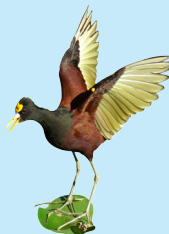
19 Gallineta de Playa Northern Jacana