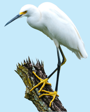
13 Garza Pie-dorado Snowy Egret