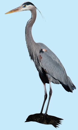
8 Garza Azulada Great Blue Heron