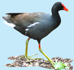
15 Gallareta Azulada Common Gallinule