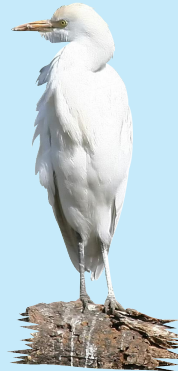
12 Garcilla Bueyera Cattle Egret